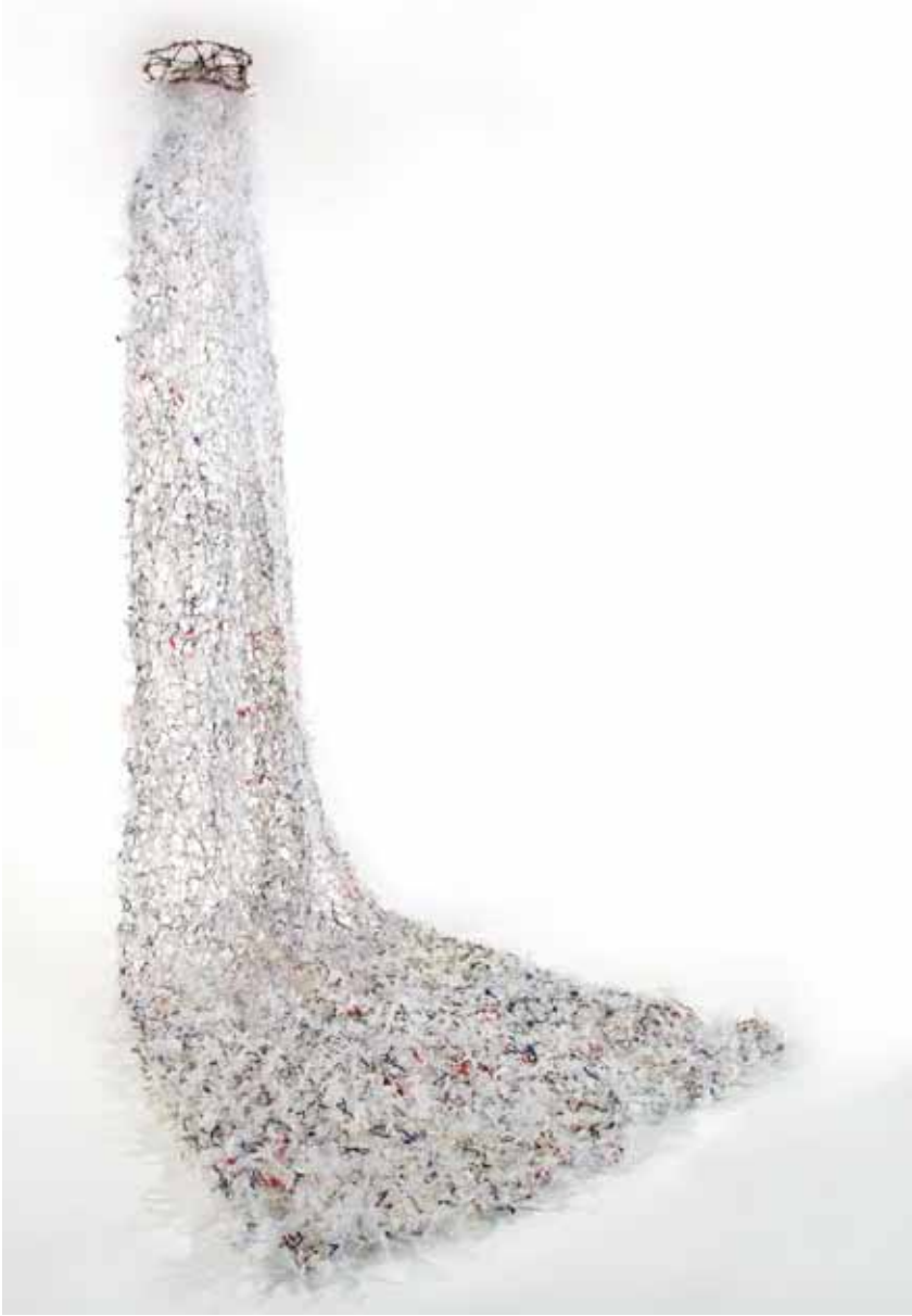
© Andrea Ceccarini Fomodema, Urbino, 2005 - Forza del destino - Collection Jean Boghossian