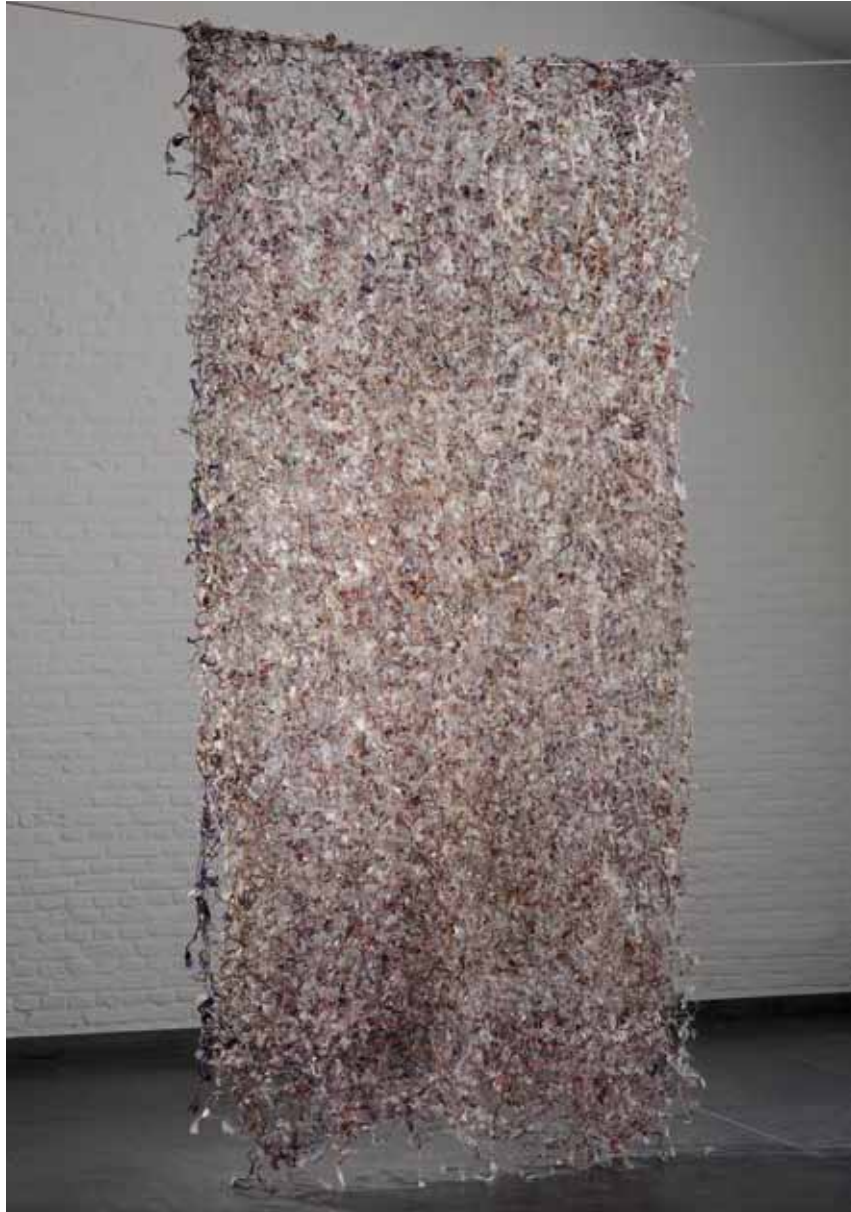
© Paul Louis - oeuvre pour la triennale de Lodz (Pologne), 2013