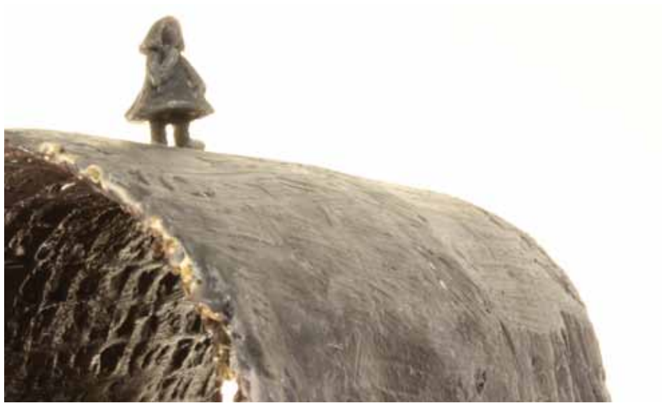
La vague (25x21x10cm - acier et bronze), 2013