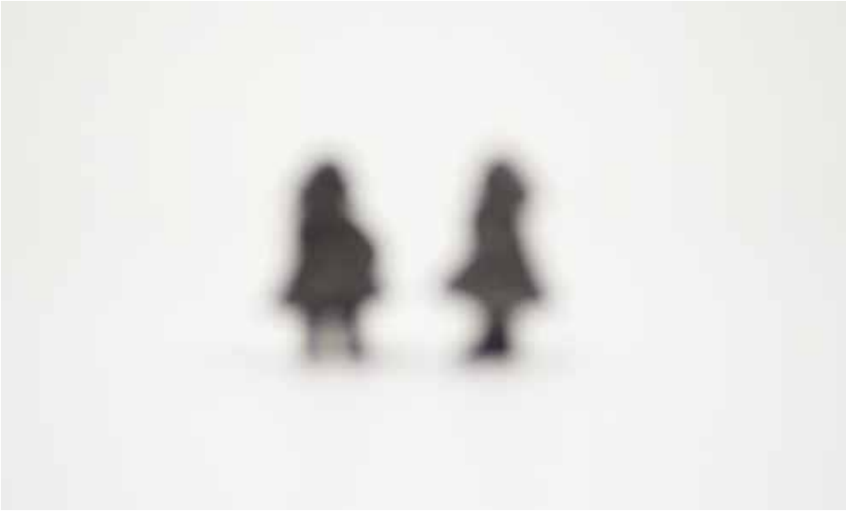
Petites filles, 2012