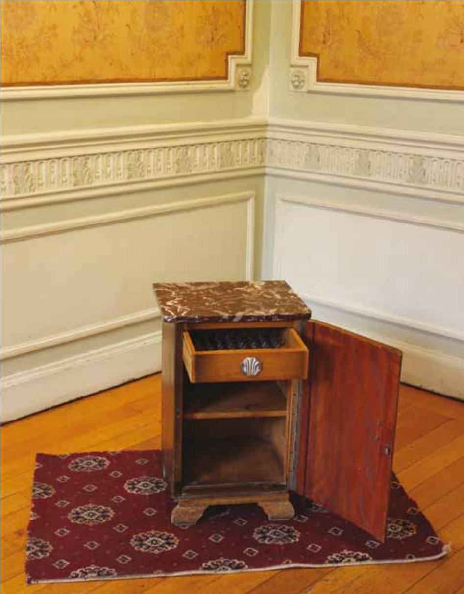
petite filles bien rangées in situ maison des arts (41 x36x64 cm)