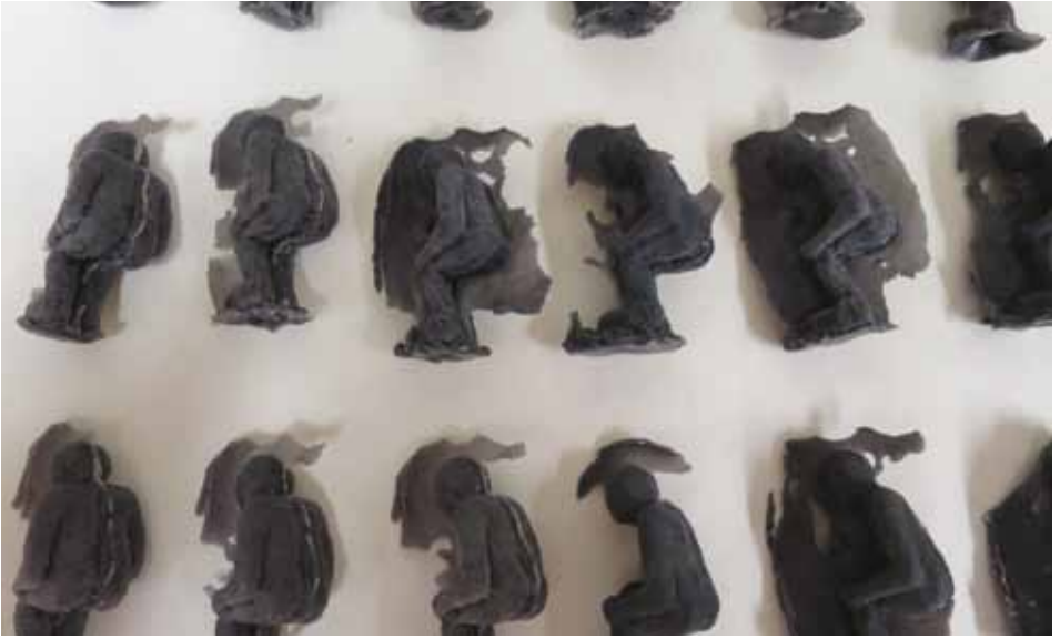
Sortis du moule - vue d'atelier