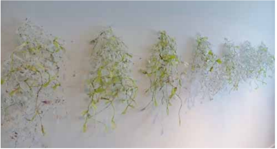
Arlotte Vermeiren - in the box project, 2014