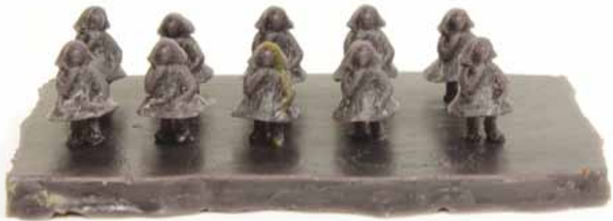
Dix petites filles (17,5x9x5cm - bronze), 2013