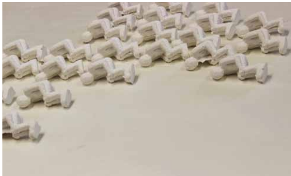
Sortis du moule - vue d'atelier