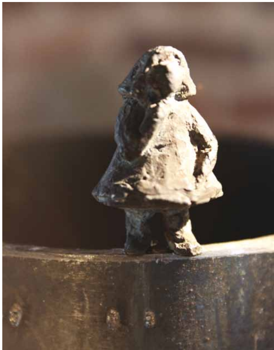
Le tuyau (détail)