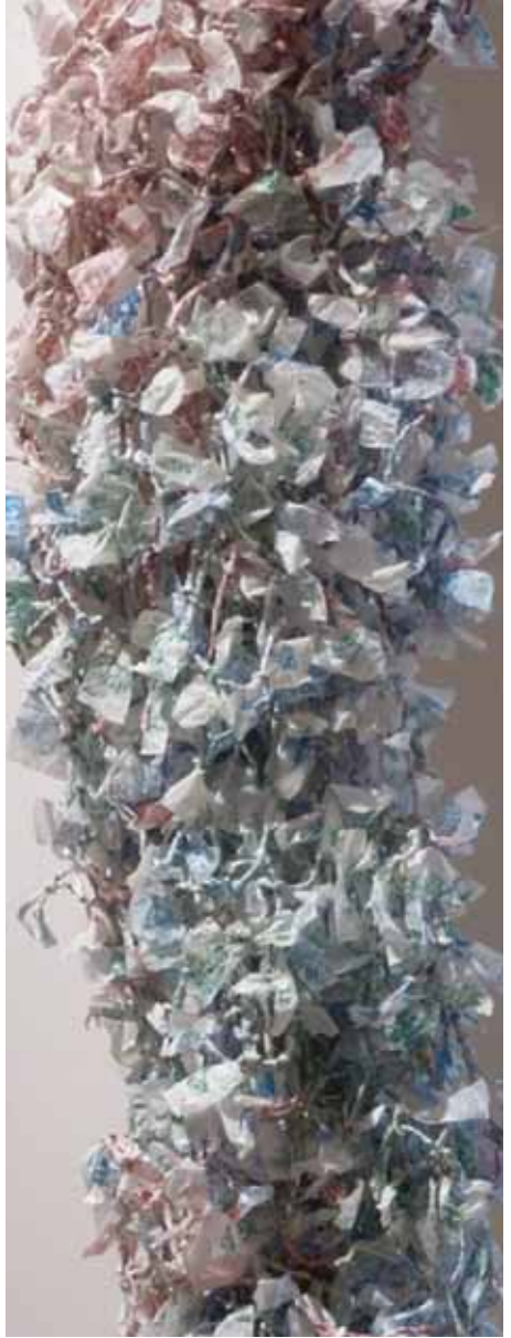
Amarretti di Saronno, 2013 (détail)