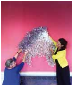
Maison des arts, 2014