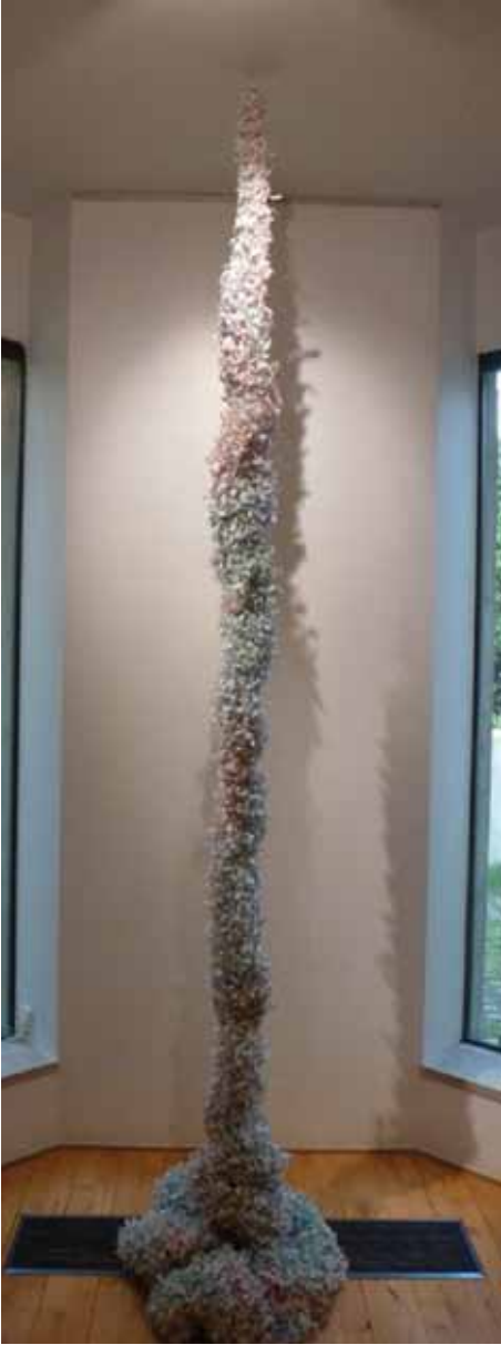
Amarretti di Saronno, 2013