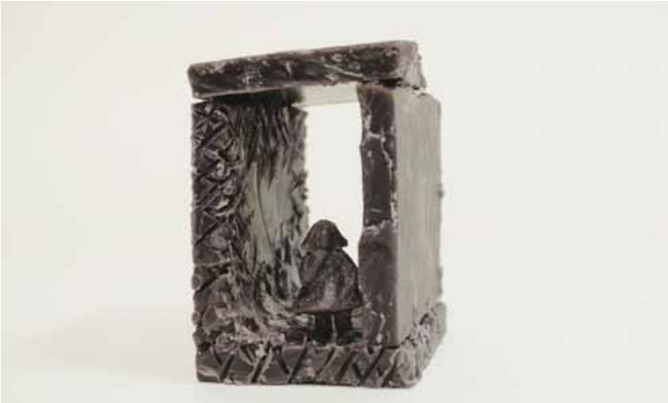
Petite fille en boîte (6,5x6x10cm - bronze), 2013