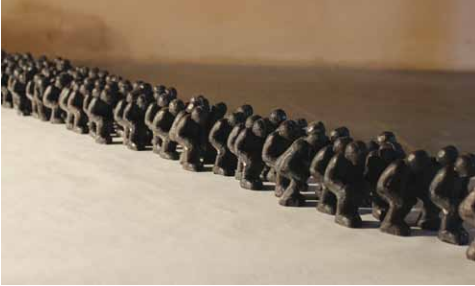
561.000 ... ,2014 (détail)