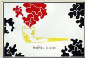
Marcel Broodthaers, « Modèle : la pipe », 1968-1969.