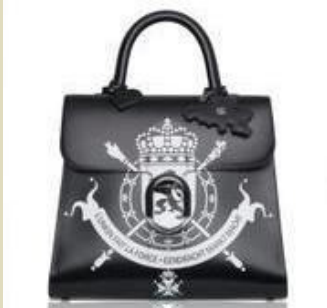
« Les Humeurs de Brillant » rendent hommage à la créativité et au savoir-faire de Delvaux.