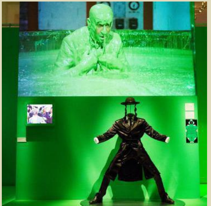
Louis de Funès, c'est 1,63 m de génie burlesque.